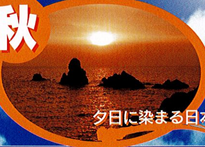
夕日に染まる日本海